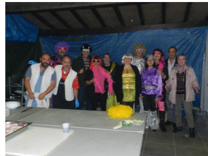
L'équipe au complet sur les starting-blocks