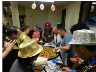
Notre paëlla servie à la cantonade