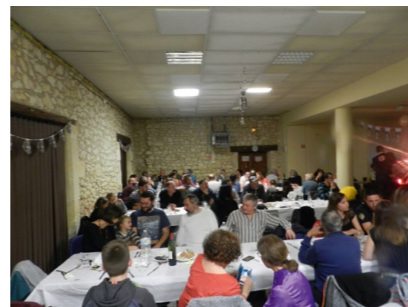
Entre plat et dancefloor