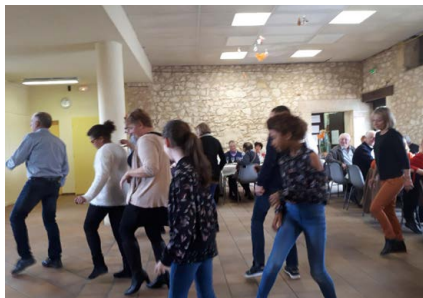
Un madison pour tous