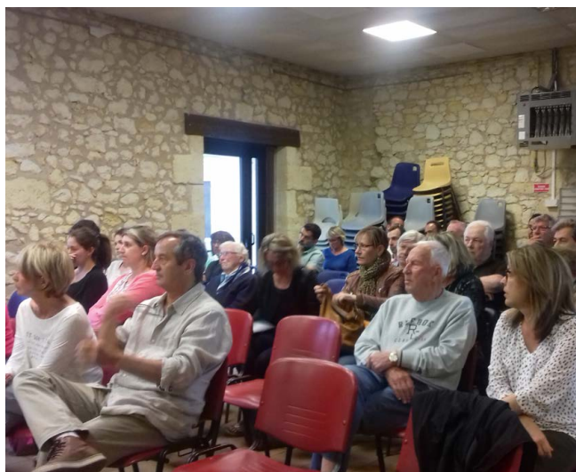
Un public attentif à la présentation du cabinet VERDI

La phase étude de la révision du plan local d'urbanisme de la commune arrive à son terme.