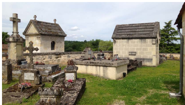
L'enherbement du cimetière

L'enherbement du cimetière réalisé en fin d'automne donne un aspect naturel qui change la vision paysagère du lieu. Les prochains travaux consistent à la mise en œuvre d'un mélange terre pierre sur l'allée de l'accès coté sacristie.