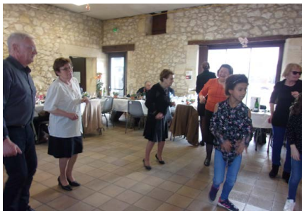
Après le repas, la danse !