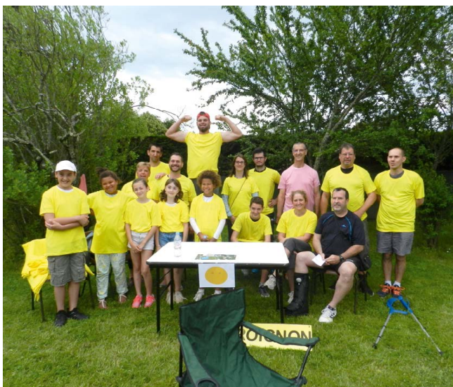
Notre équipe 2018 pleine d'enthousiasme, prête pour l'aventure !

Le 09 Juin, sous un magnifique soleil, nos amis de Le Pout ont eu la responsabilité d'organiser cette manifestation conviviale.