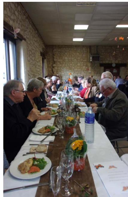
Un délicieux repas