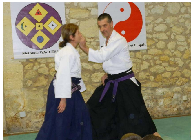
Démonstration par le responsable technique

➔ La découverte, le respect et la mise en pratique des cérémoniaux traditionnels, des règles du Bushido (code d'honneur et de morale traditionnel des arts martiaux), des valeurs ancestrales sont une mise en condition nécessaire à la progression du pratiquant.